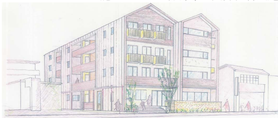
外観パース(※パースご協力 無有建築工房)